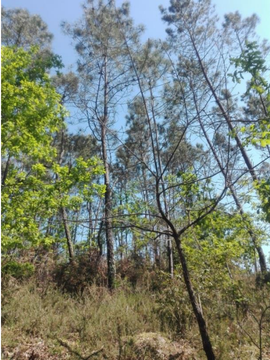
Imagem 6: Pinheiro bravo