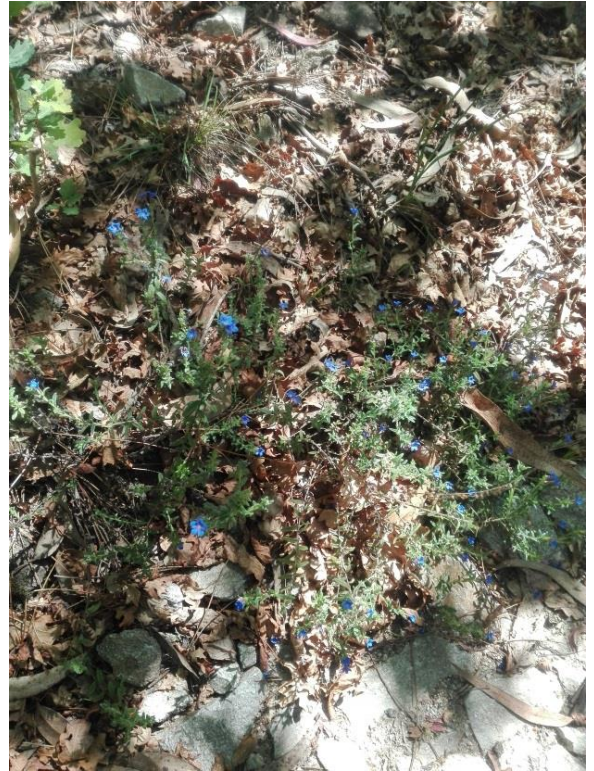
Imagem 4: Nome desconhecido