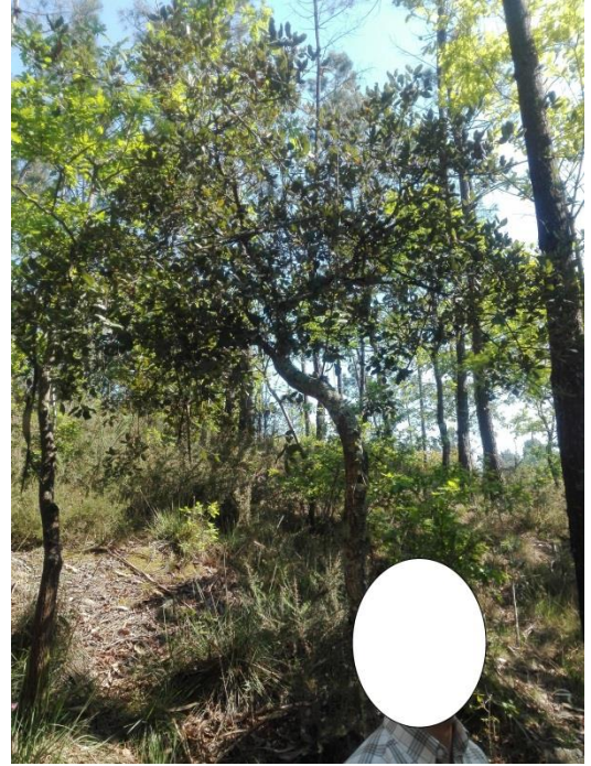
Imagem 7: Sobreiro