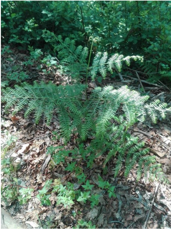
Imagem 3: Feto comum