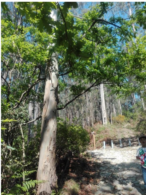
Imagem 1: Carvalhos

Antes da visita ao parque os alunos visionaram um pequeno filme (promovido por funcionários da Câmara Municipal de Oliveira de Azeméis) sobre a origem deste parque, como é feita a sua conservação e a importância que tem para a nossa região. As crianças tiveram oportunidade de colocar questões e expor as suas dúvidas. De seguida fomos para o terreno, descobrir a fauna e flora existente no parque. Não conseguimos observar nenhum animal pois o barulho era muito. Tirámos fotografias e desenhámos as plantas e árvores que mais gostámos. Nesta fase da visita tivemos ajuda de um funcionário da Câmara Municipal de Oliveira de Azeméis que nos ajudou nos nomes e na importância de cada espécie.