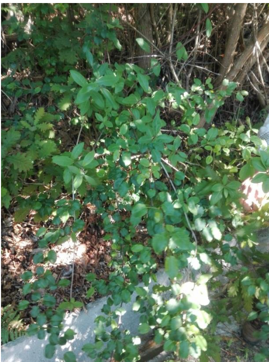
Imagem 5: Pereira brava